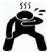
FAIGATA ONA MĀNAVA